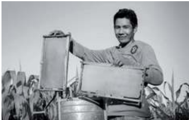
Imker in Harms, Südafrika

Auf dem Weg der Gerechtigkeit Eröffnung der 60. Aktion Spenden Sie mit beigefügtem Überweisungsträger.