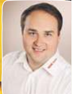
Ihr selbständiger Kaufmann in Ebersberg und Kirchseeon

Entdecken Sie jetzt die vielen regionalen und lokalen Produkte in Ihrem REWE Markt.